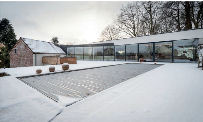
Het buitenschrijnwerk is van het merk Sapa.

Tekst: Jeroen Kuypers