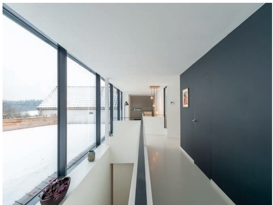
Het is niet te zien welk gedeelte van de woning oud- en welk nieuwbouw is.

De keuken bevindt zich in het verlengde van de living. De kasten en de apparatuur zijn grotendeels aan één wand ingebouwd. Om de hoek is een gang met opbergruimtes, keurig uit het zicht. Een lange tafel wordt gebruikt voor de maaltijden, hoewel dat ook aan een tafel in de living kan gebeuren. Twee metershoge ramen zorgen ervoor dat er ook in de keuken voldoende daglicht binnenvalt en dat er zicht is op de oprit en de beneden gelegen straat.