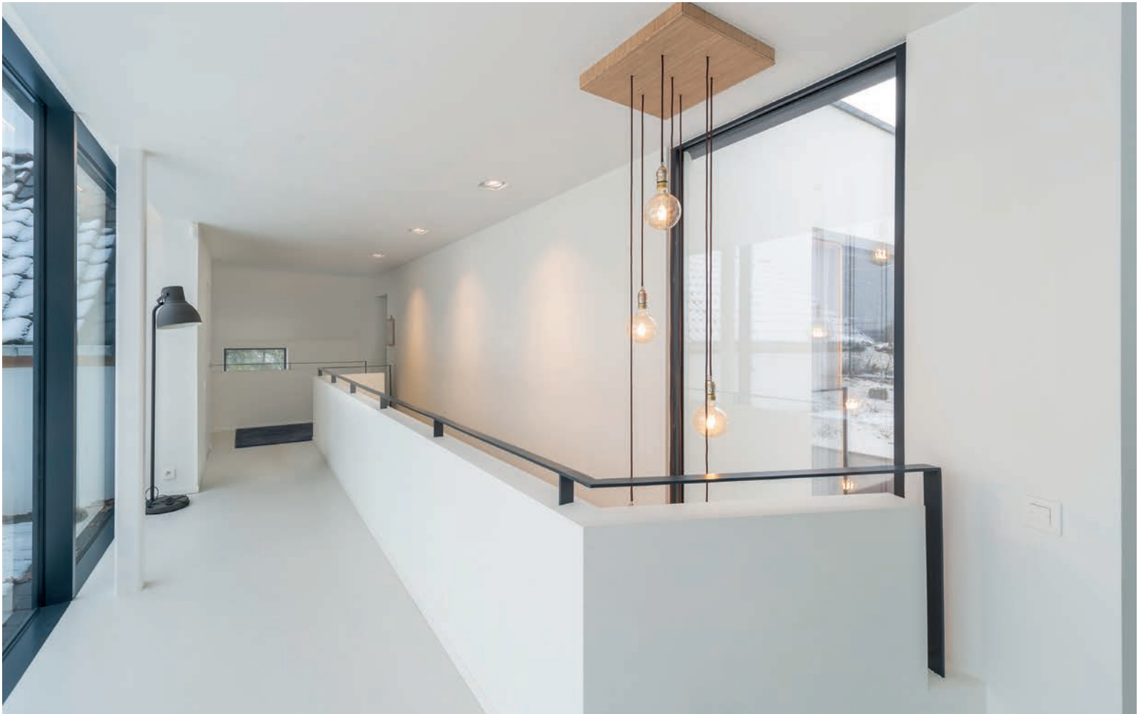
Vides geven de woning licht en een gevoel van ruimte.