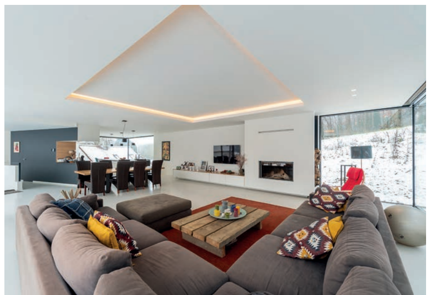
De living met open keuken ligt op de eerste verdieping, maar doordat de grond oploopt, lijkt het ook begane grond.

De nieuwbouw aan de achterkant biedt een overdaad aan ruimte. Op het gelijkvloers is er bijvoorbeeld een grote kamer die aanvankelijk bedoeld was als extra slaapkamer, maar die bij nader inzien een functie als bergruimte kreeg. De woonfuncties zijn op het eerste verdiep geconcentreerd. Via de trap komt men in een grote living met open keuken. Maar op het moment dat je de laatste trede opstapt, doet zich een merkwaardig effect voor: je hebt het gevoel nog steeds op ‘een’ gelijkvloers te staan. Dat komt doordat het huis schuin opwaarts