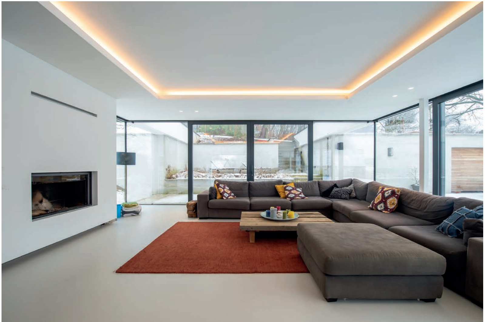
De open haard is van het merk Stuv.